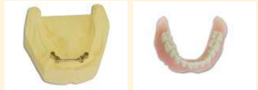
het vastzittend deel: de implantaten

implantaten ter sprake komen. Het ondergebit zit vaak te los omdat uw kaak ver geslonken is. Vaak is er dan geen hoogte meer aanwezig om het kunstgebit op vast te houden. Wanneer u ermee instemt om in de onderkaak implantaten te laten plaatsen, verwijst de tandprotheticus u schriftelijk naar de implantoloog met wie hij samenwerkt.